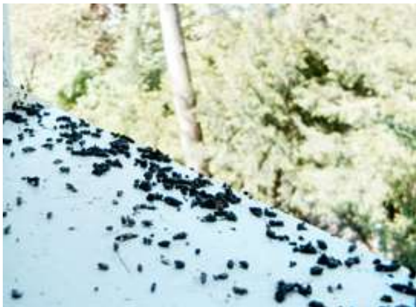
Abb. 1: Fledermauskot auf einem Fensterbrett