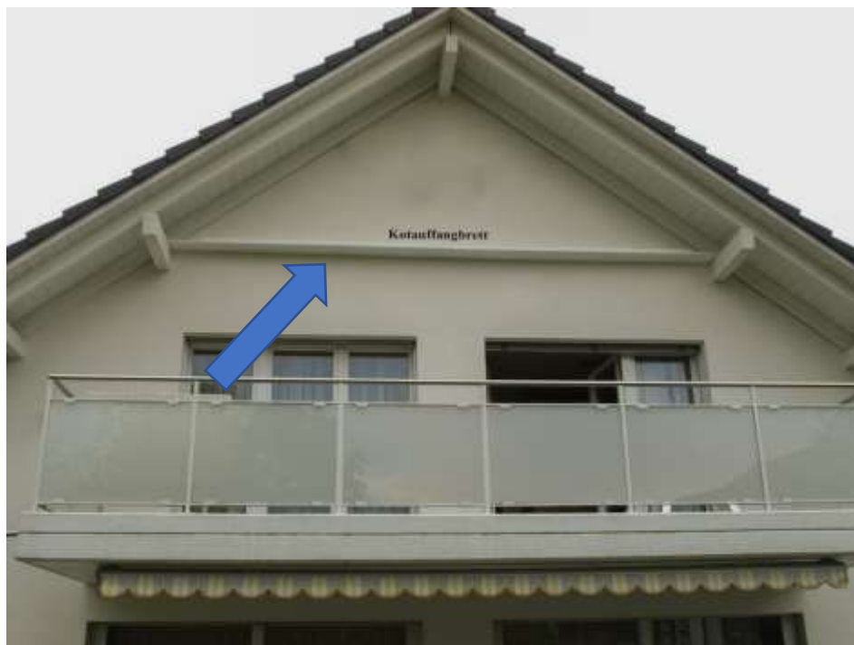
Abb. 3: Kot-Auffangbrett über einem Balkon

Wurde Ihr Problem mit unseren Vorschlägen nicht gelöst oder haben Sie weitere Fragen? Dann kontaktieren Sie uns. Wir vermitteln Sie bei Bedarf an unsere Partner in Ihrer Region.