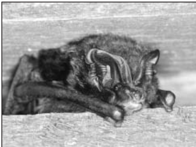
Die Mopsfledermaus ( Barbastella barbastella ) ist dank ihrer mopsartigen Schnauze und den an der Basis zusammengewachsenen Ohren wohl unverwechselbar. In der Schweiz und den umgebenden Ländern zählt sie zu den seltensten Fledermausarten.

Noch in den 1950er Jahren war die Mopsfledermaus im Mittelland vermutlich weit verbreitet, worauf die wenigen verfügbaren Quellen hindeuten. Nach 1980 gab es allerdings keinen neuen Nachweis mehr aus dieser Region, ein Bestandsrückgang ist deshalb zu vermuten. Ein Blick über die Schweizer Grenzen bestätigt diese Mutmassung, selbst