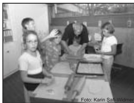
Mmh, riecht das gut! Begeistert haben die Kinder Guetzli ausgestochen und verziert!