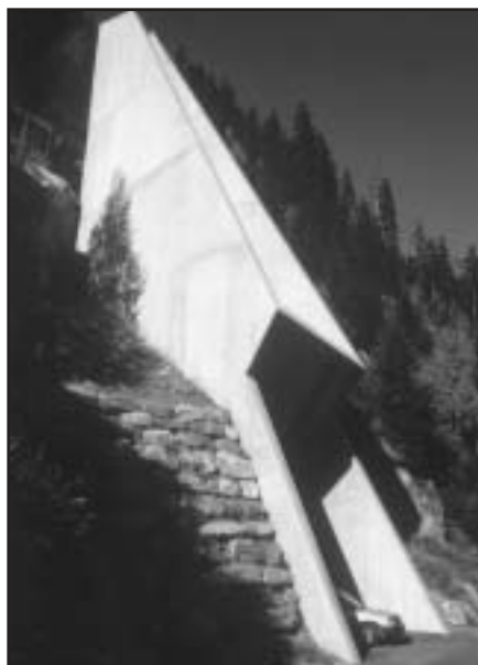
Eingang zum Lüftungsstollen in der Val Nalps.

Die Regionale Fledermausschutzexpertin dankt allen Beteiligten der Neat-Baustelle herzlich für die speditive Umsetzung dieser Massnahme zum Schutz der Fledermäuse.