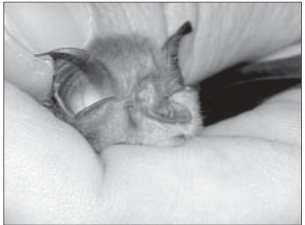
Wie winzig die Kleinen Hufeisennasen sind, wird deutlich, wenn z.B. im Bild der Kopf mit dem Daumnagel daneben verglichen wird. Hier abgebildet ist das berggängige Weibchen W42.

Sie sind abrufbar unter: http://www.Rhinolophus.net unter der Rubrik /projects